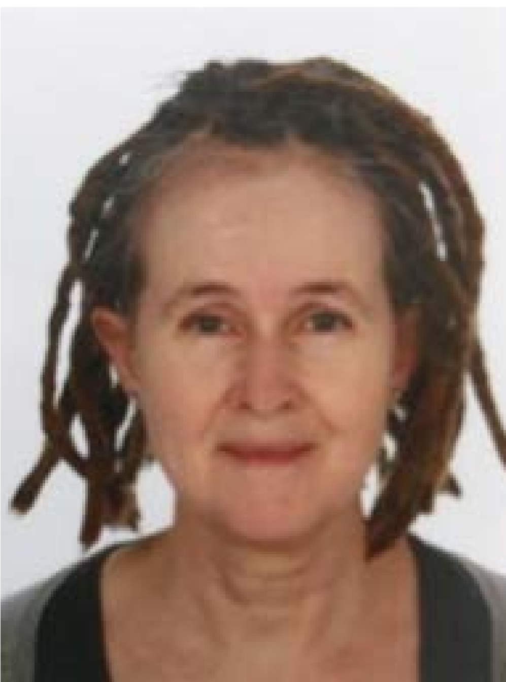
Bougien ter Haar